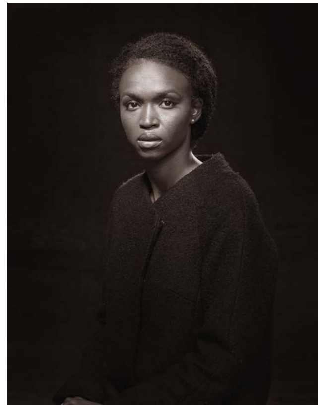
Helida 7 oktober 2015