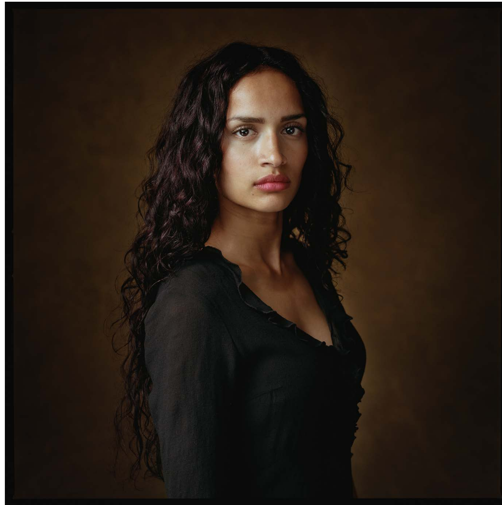
Roseniedebie juli 2014

gaat ook niet om iets uiterlijks wat haar raakt. Tijdens het boodschappen doen bij Albert Heijn zag ze een meisje staan dat achter de infobalie werkte. Ze was heel onopvallend: geen make-up, staartje in en dat lelijke blauwe AH-vestje aan. "Roseniedebie viel mij op. Ze is nog best jong en ze was iets aan het uitleggen aan een jongen van haar eigen leeftijd. En aan de manier waarop ze dat deed, kon je zien dat ze heel veel weet en veel ervaring heeft, maar ze legde het zo lief uit. Ze stond helemaal niet boven die jongen, was niet denigrerend, en dat vond ik zo sympathiek. Daarom heb ik haar aangesproken. En toen ze bij mij in de studio kwam, een beetje opgemaakt, dacht ik: jeetje! Ik heb veel met haar gepraat. Ze vertelde dat ze sinds haar vijftiende werkt en haar eigen huur betaalt. Haar moeder heeft vijf kinderen en geen geld om de opleiding te betalen. Ze werkt al heel lang bij Albert Heijn, heeft daar een leidinggevende functie, en is nu al klaar met haar studie. Ze is nu 21 en ze heeft haar hele studie zelf betaald. En zoals ik haar zag bij Albert Heijn met die jongen, zo was ze dus in het echt ook. Voor haar leeftijd heel erg volwassen, en op een heel lieve manier."