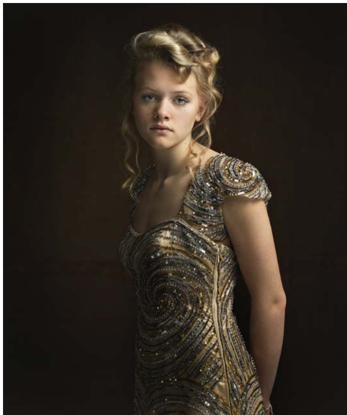
Brechje 7 november 2015

HAAR EN MAKE-UP: ARTHUR VRIENS. MET DANK AAN DAAN WIEMANS VOOR HET GEBRUIK VAN DE JURK.