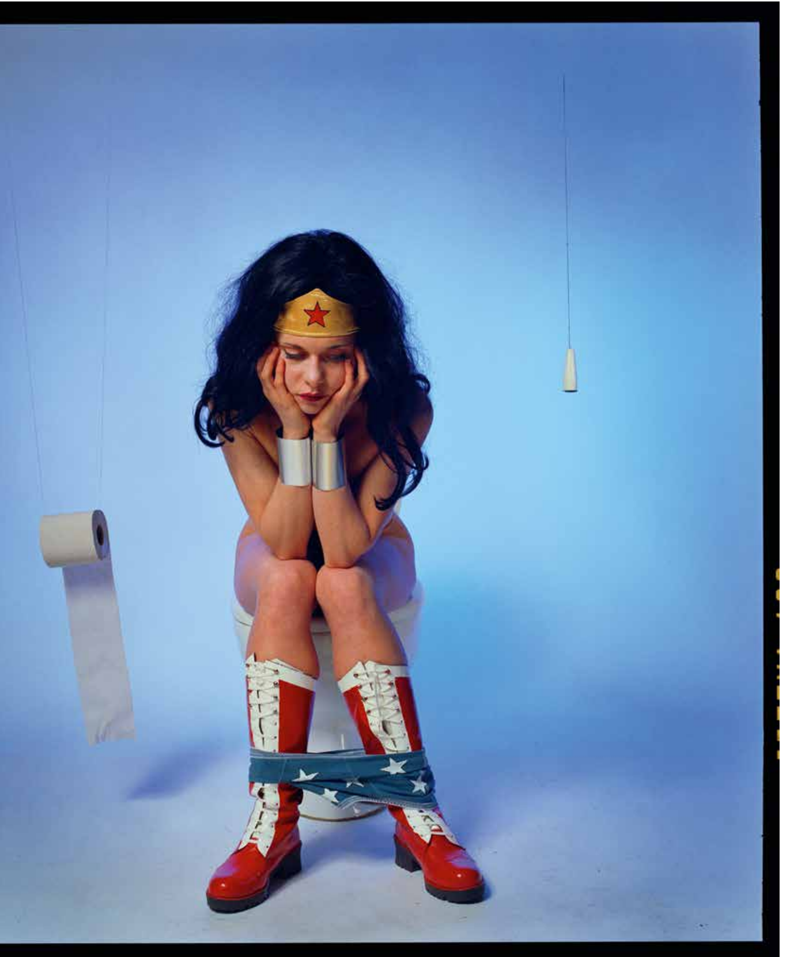
Wc, uit de serie Wonderwoman