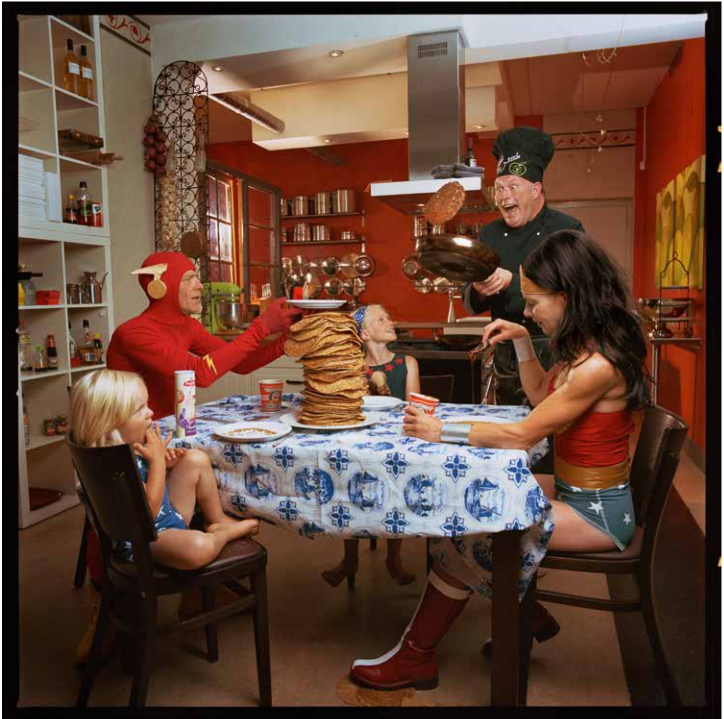
Pannenkoek, uit de serie Wonderwoman