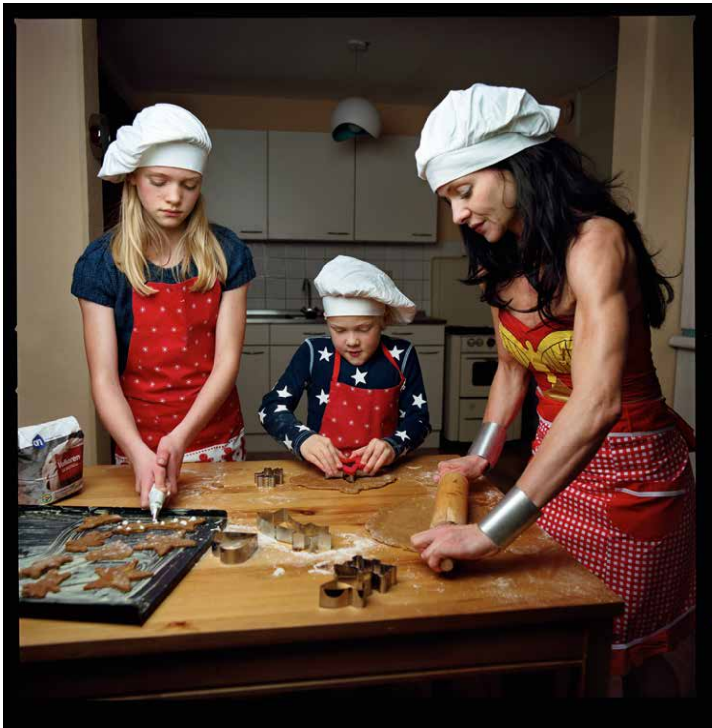
Koekjes, uit de serie Wonderwoman